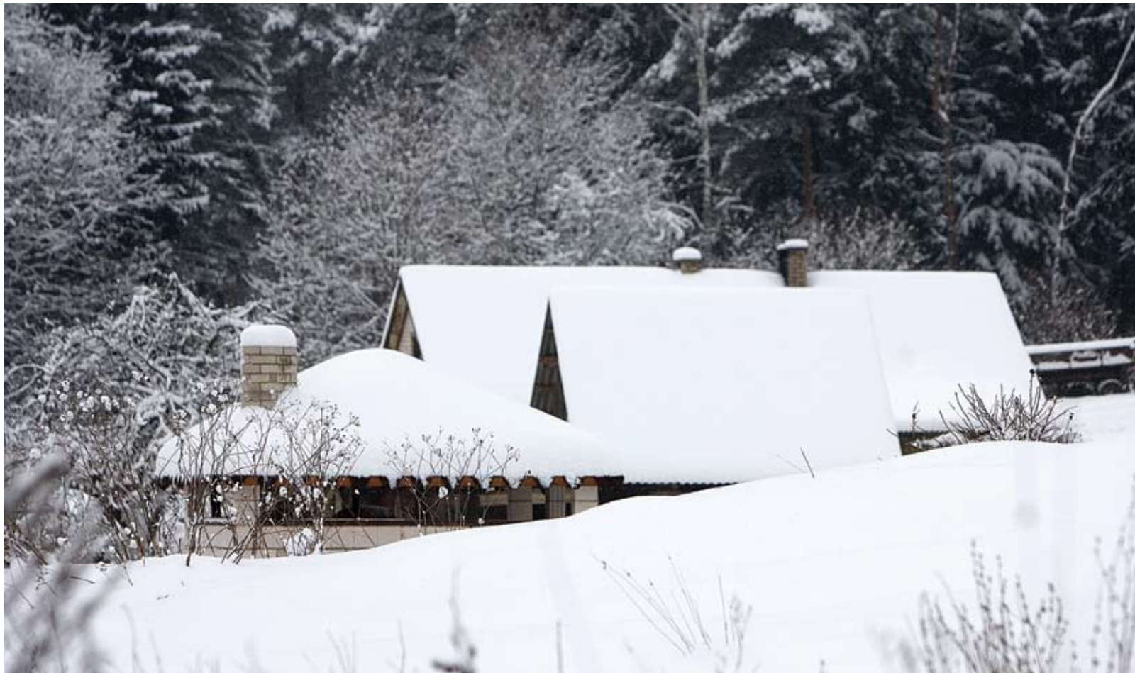
▶ JEI STOGAI ilgai nevalomi ir neprižiūrimi, draudikai turi teisę atsisakyti mokėti draudimo išmoką.

Ji pažymi, kad 20 cm sniego per 12 val. – labai retas reiškinys Lietuvoje. Be to, LHT dažniausia turi paros, o ne 12 val. laikotarpio duomenis. Pasak p. Galvonaitės, 2009 m. pradžioje Kaune snigo stipriai, tačiau